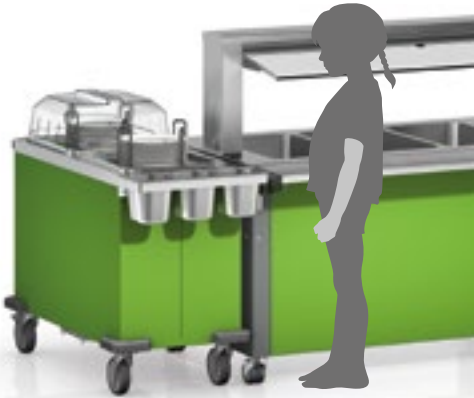
Optimale Ausgabehöhe (750 mm) für Kinder bis ca. 10 Jahre