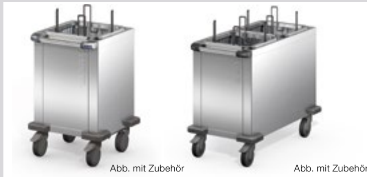
Abb. mit Zubehör