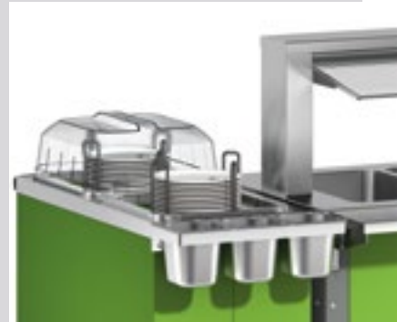
Abb. mit Zubehör